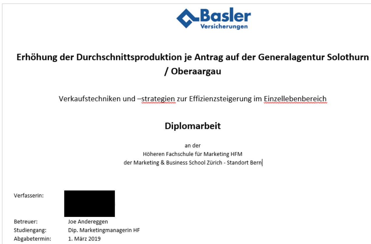
Abb. 1 - Bsp. Titelblatt

Beispiel eines Titelblattes für eine Diplomarbeit der Höheren Fachschule Wirtschaft: